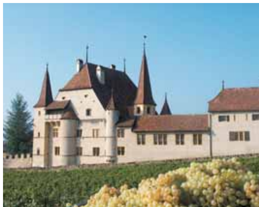
Château de Cressier