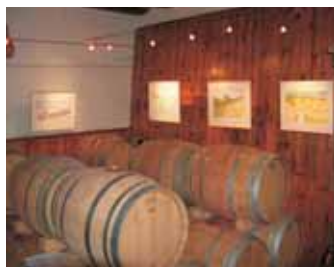
Barriques & Arte & Vini

Chez le vigneron c'est tellement plus sympa !